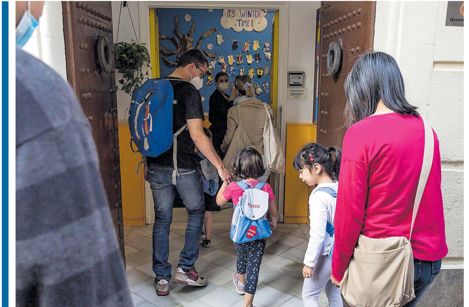
Pares i mares acompanyant els seus fills a classe, ahir.