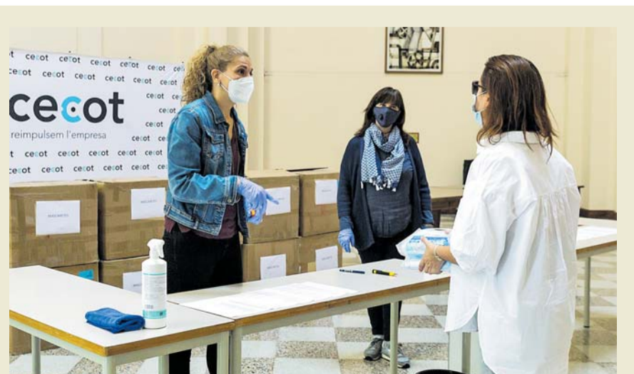
Una empresària recull mascaretes a la seu de la patronal Cecot. LLUÍS CLOTET

L'administració municipal va donar ahir 50 mil mascaretes a l'Agrupació de Polígons de Terrassa, que repartirà entre 2.800 empreses. Jordi Ballart, alcalde de Terrassa, va assegurar a l'acte, a la seu de la patronal Cecot, que l'Ajuntament estudiarà noves mesures fiscals per oferir liquiditat a emprenedors, autònoms i empreses locals en aquesta etapa de crisi motivada per la Covid-19. PÀGINA 7